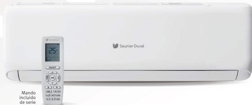
Mando incluido de serie