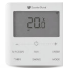
Control cableado (incluido)