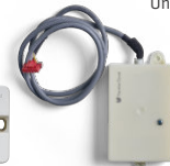
Accesorio ModBUS (opcional)