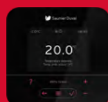
MiPro Sense Radio